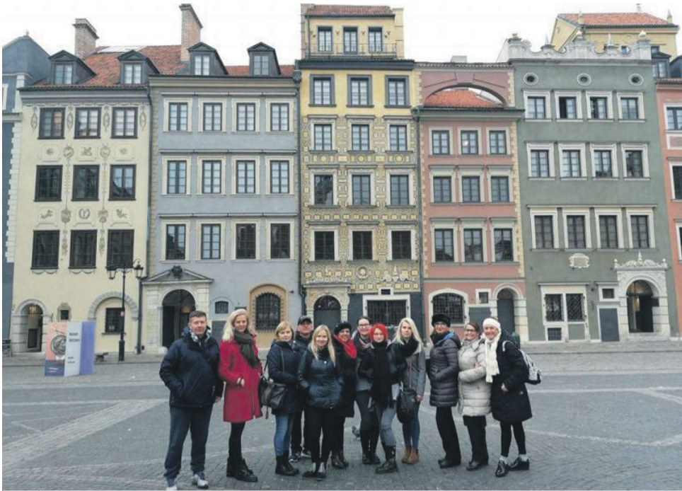
SSOŠ Pro scholaris na nadnárodnom stretnutí Erasmus+.